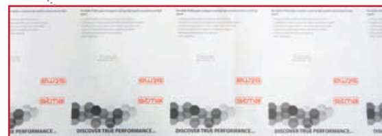
Przykładowe koperty z roli.